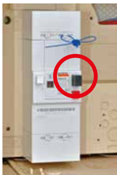
Disjoncteur désarmé (bouton noir sorti) Hors service